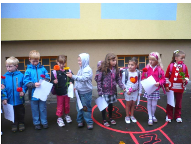
Prvňáčci před školou