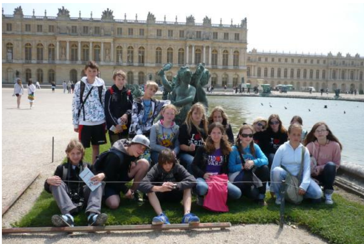
Žáci naší školy před zámkem Versailles