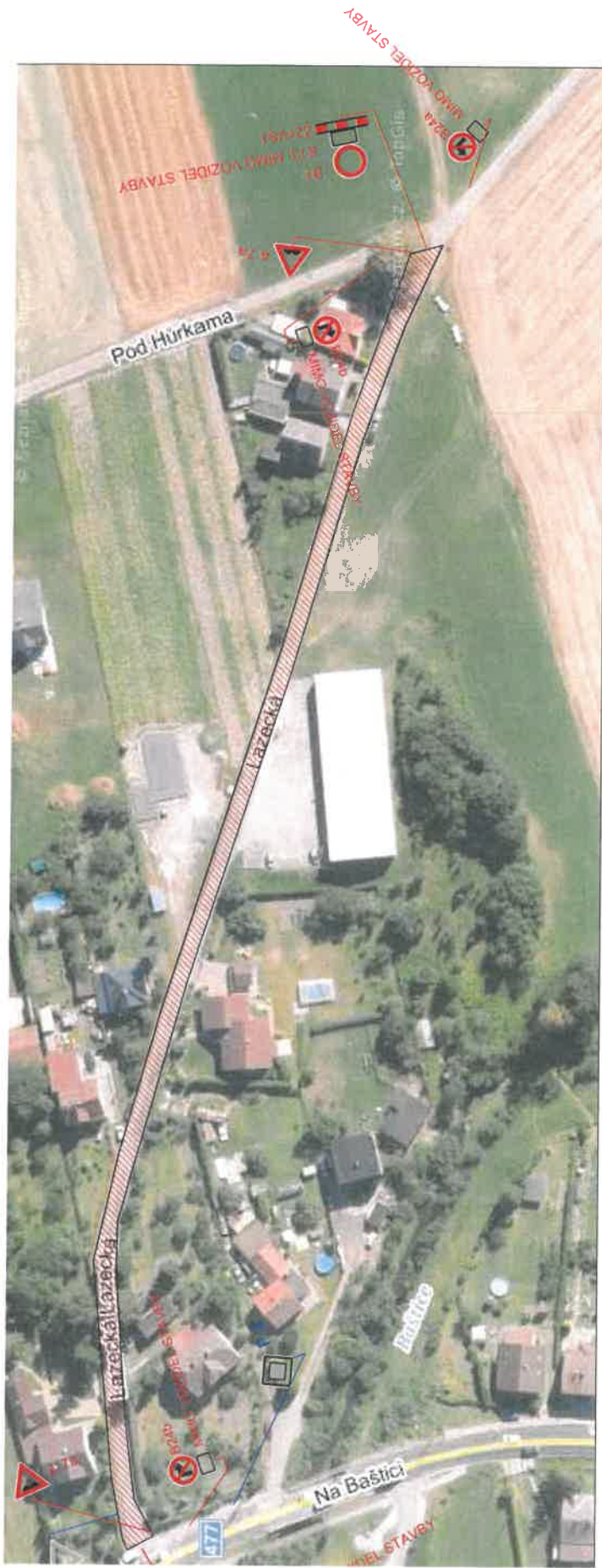
SITUACE PDZ – VNĚJŠÍ ČÁST