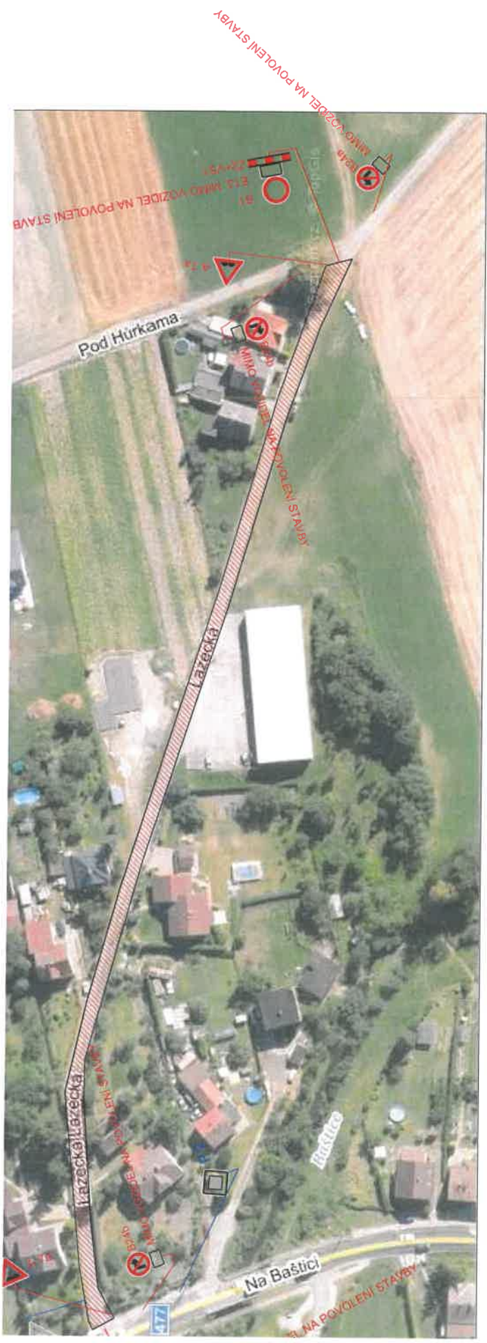
SITUACE PDZ – VNĚJŠÍ ČÁST