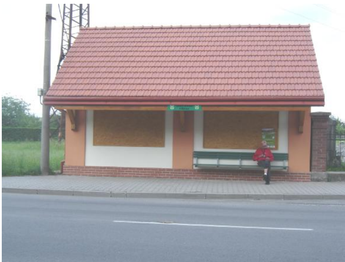
Nová autobusová zástavka Staré Město-hřbitov