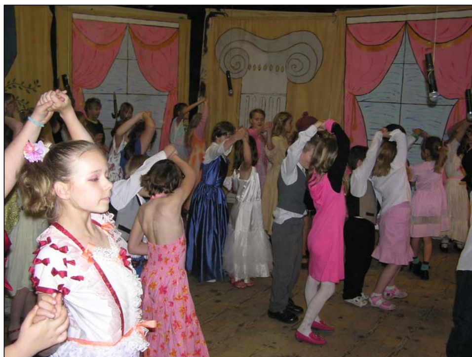
Ukázka z divadelní hry „Láďo, ty jsi princezna“