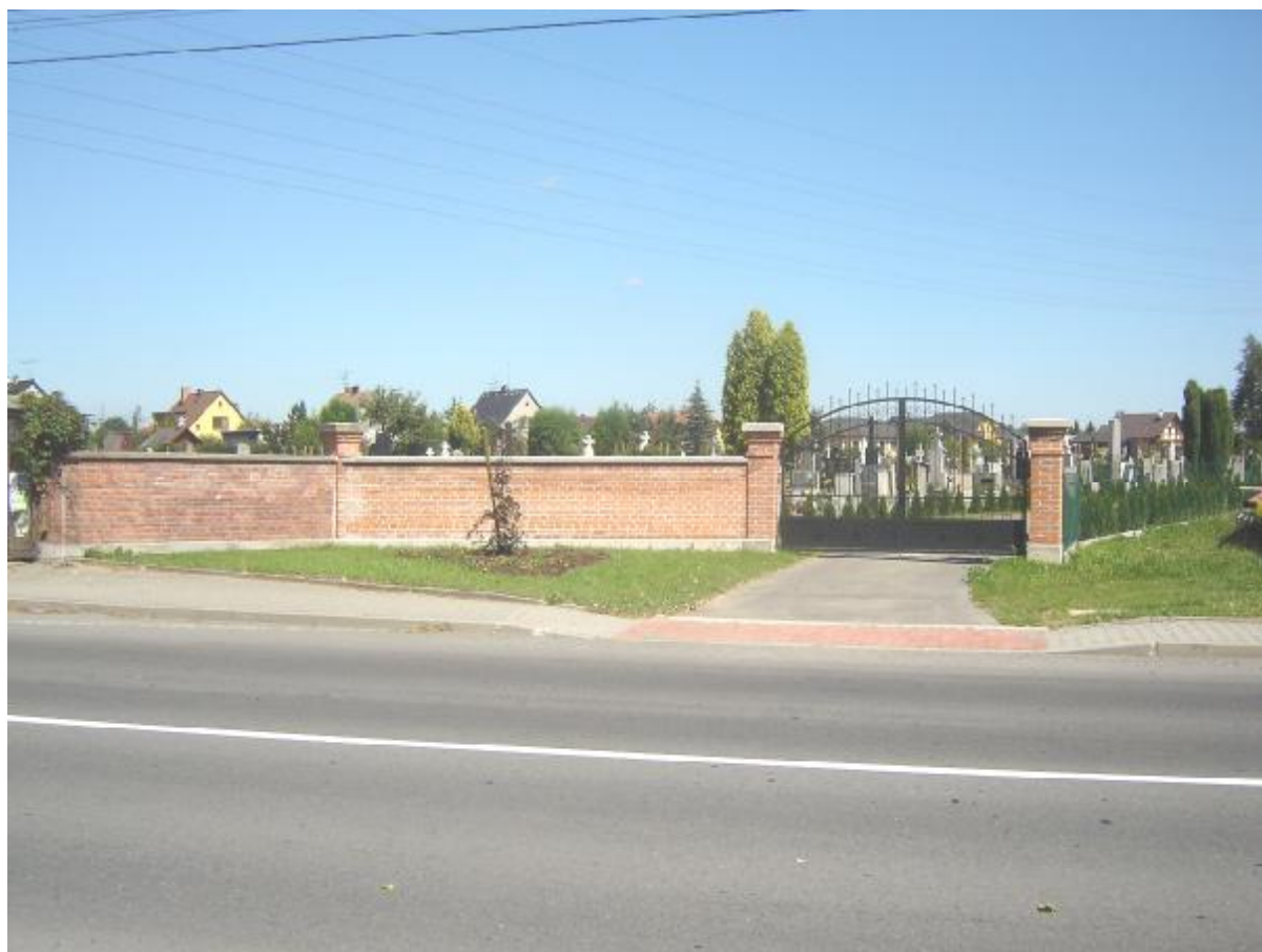
Nově vybudovaná obslužná komunikace hřbitova